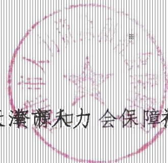
天津市人力资源和社会保障局