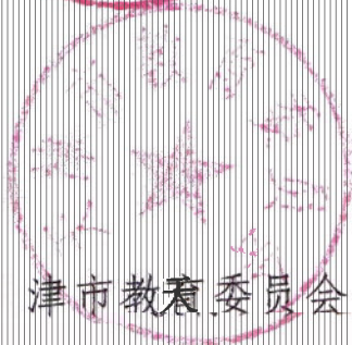
天津市教育委员会